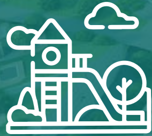
Çocuk Oyun Alanları